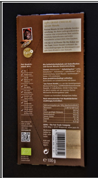
Gepa: Grand Chocolat Garam Masala, fair+ Bio Vollmilchschokolade mit Garam-Masala Gewürzmischung, Tafel 100 g 2,50 €