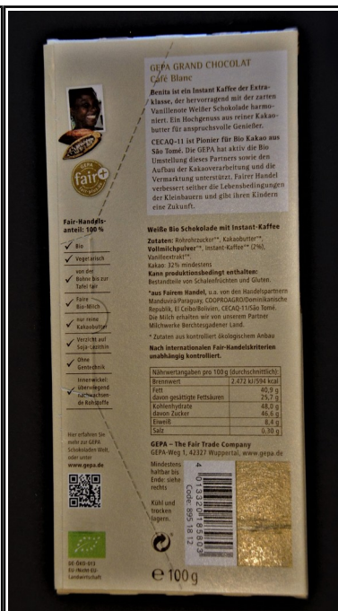
Gepa: Grand Chocolat Café Blanc, fair+ weiße Bioschokolade mit Instand-Kaffee, Tafel 100 g 2,50 €