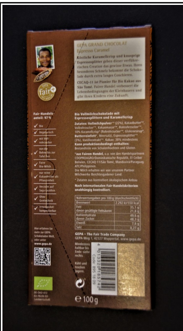
Gepa: Grand Chocolat Espresso Caramel, fair+ Bio Vollmilchschokolade mit Esspressosplittern und Karamellrisp, Tafel 100 g 2,50 €