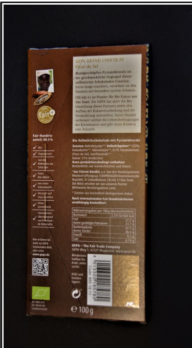
Gepa: Grand Chocolat Fleur de Sel, fair+ Bio Vollmilchschokolade mit Pyramidensalz, Tafel 100 g 2,50 €