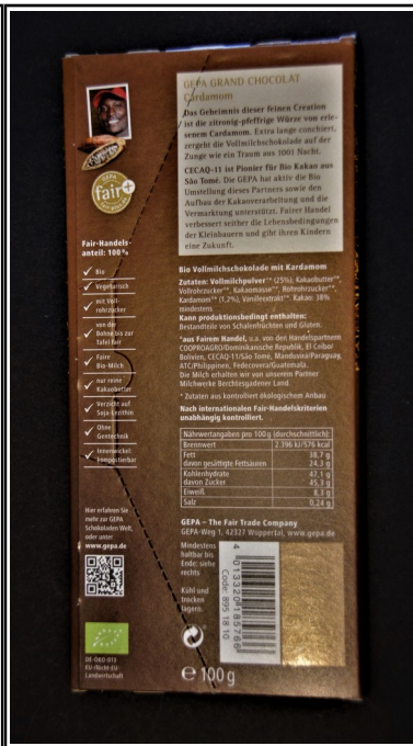
Gepa: Grand Chocolat Cardamom, fair+ Bio Vollmilchschokolade mit Kardamom, Tafel 100 g 2,50 €