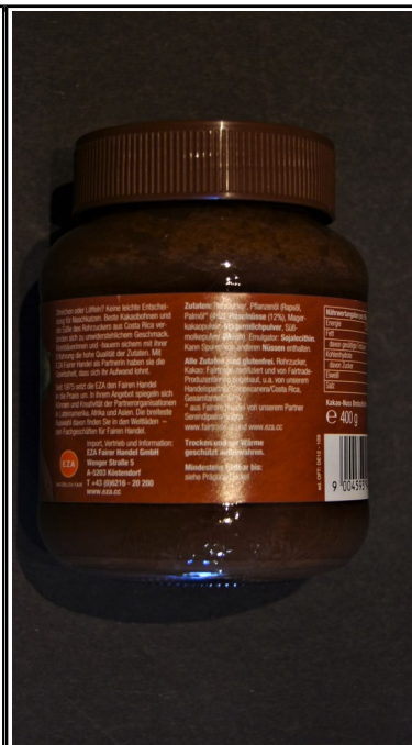
eza: EQUITA, Bio Kakao-Nuss-Brottaufstrich Glas 400 gg 4,50 €