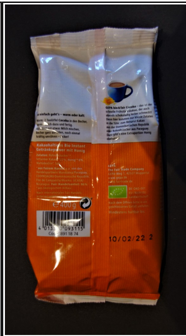
Gepa: Cocoba, fair+ Bio Frühstückskakao mit Honig, Tüte 400 g 4,80 €