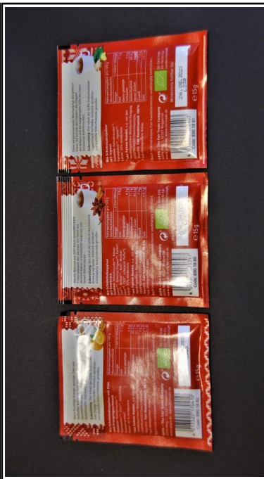
Gepa: Bio Trinkschokolade mit Gewürzen, fair+ Zimt Orange, Oriental, Ingwertraum Tüte 15 g 0,60 €