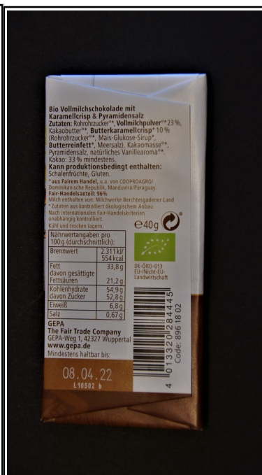
Gepa: Caramel Salzfair+ Bio Vollmilchschokolade mit Karamellcrisp und Pyramidensalz, Tafel 40 g 1,00 €