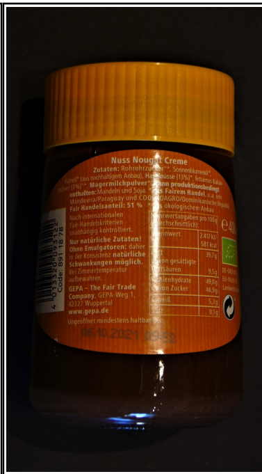
Gepa: Cocoba, fair+ Bio Nuss Nougat Creme Glas 400 g 4,80 €