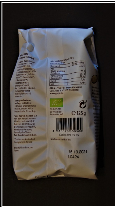
GEPA: Schoko Orangen Taler, fair+ Bio, Mürbegebäck, 125 g 2,00 €