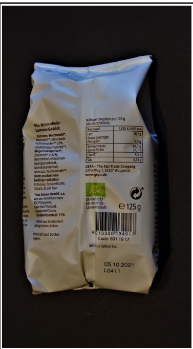
GEPA: Mascobado Lemon HERZEN, fair+ Bio, Mürbegebäck, 125 g 2,00 €