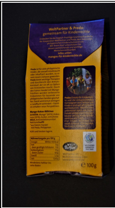
Welt Partner: Mango Kokos Bällchen Bio, 100 g 4,00 €