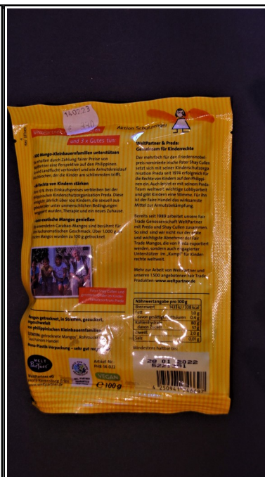
Welt Partner: Mango Streifen getrocknet, 100 g 3,30 €