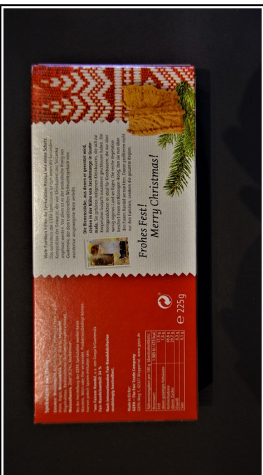
GEPA: Spekulatius, fair+ mit Honig, 225 g 2,40 €