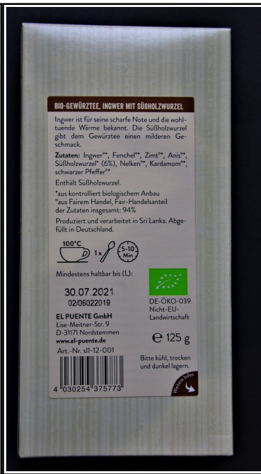
El Puente: Gewürztee, BIO Ingwer mit Süßholzwurzeln, 125 g 4,90 €