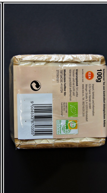
EZA: Ceylon, BIO Schwarzer Tee, 100 g 3,95 €