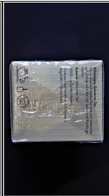
El Puente: Kilimanjaro-Tee Schwarzer Tee, Teebeutel 20x2,0 g 2,50 €