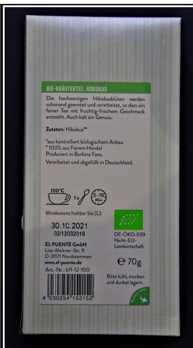
El Puente: Hibiskzs, BIO Kräuterte, 70 g 2,50 €