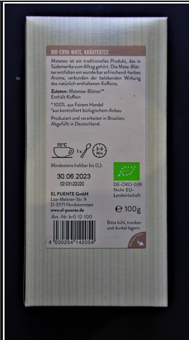
El Puente: Erwa-Mate, BIO Grüner Mate-Tee 100 g 1,90 €